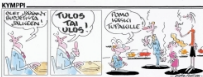
Tapiolan Acta-lehden Kymppi-sarjakuva

Sarjakuva samoin kuin pilapiirroskin ovat lehden luetuinta aineistoa. Oma sarjakuva keventää sisältöä ja sitoo lukijoita lehteen. Kerberoksen sarjakuvia esiintyy mm. Pakkaus-lehdessä ja Tekniset-lehdessä .