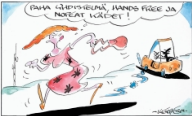
Piirros julkaistu Finnetin asiakaslehdessä vuonna 2002.

Kerberoksen piirrosten kysyntä kasvaa jatkuvasti. Ne kuvittavat lukuisia lehtijuttuja ja keventävät mainossanomiamia ja tiedottajien tekstejä.