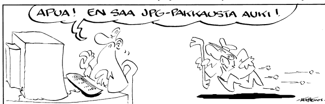
Pakkaus-lehden Puke on Suomen vanhimpia jatkuvasti ilmestyneitä ammattilehden sarjakuvia.

Sarjakuva samoin kuin pilapiirroskin ovat lehden luetuinta aineistoa. Oma sarjakuva keventää sisältöä ja sitoo lukijoita lehteen. Kerberoksen sarjakuvia esiintyy mm. Pakkaus-lehdessä ja Tekniset-lehdessä .