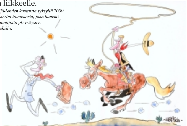
Yrittäjä-lehden kuvitusta syksyllä 2000. Juttu kertoi toimistosta, joka hankkii asiantuntijoita pk-yritysten hallituksiin.

Kerberos kuvittaa myös lehtijuttuja. Piirros on usein herätteellisempi kuin valokuva. Se pistää mielikuvituksen liikkeelle.